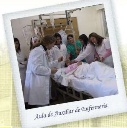
Aula de Auxiliar de Enfermería