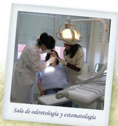
Sala de odontología y estomatología

En torno al 55% del alumnado que ha finalizado el Ciclo está trabajando en empresas donde han realizado la FCT o en empresas del sector.